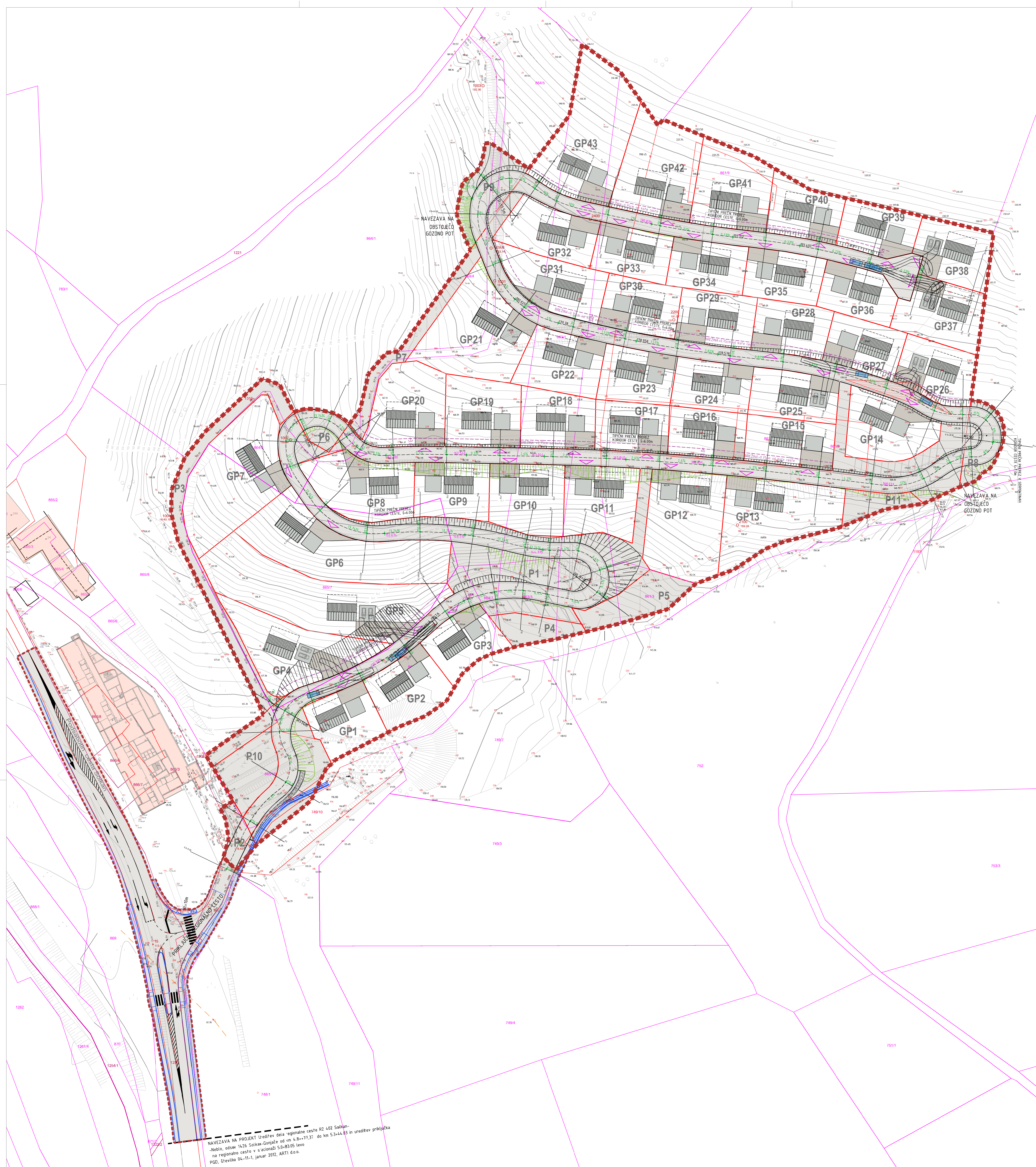
PRIKAZ OBRČALIŠČA M 1:500